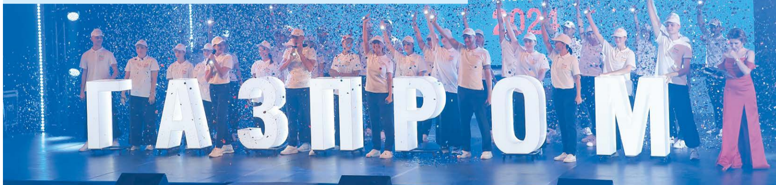
Фестиваль труда ПАО «Газпром» собрал в Томске более 200 участников из 45 дочерних обществ

В общекомандном зачете Фестиваля труда ПАО «Газпром» коллектив ООО «Газпром трансгаз Томск» завоевал первое место.