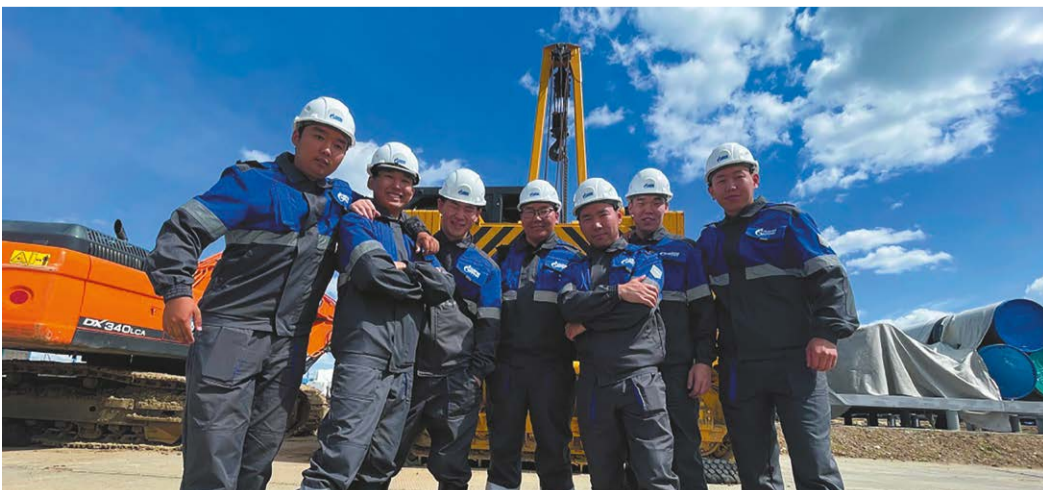
Бойцы студотряда «Молодая магистраль» в Алданском ЛПУМГ

го интеллекта показала свою высокую эффективность в сравнении со стандартными механизмами.