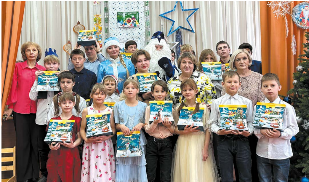
Десятки подшефных учреждений получили подарки от газовиков

– Ребята подросли, и в этом году мы постарались удивить форматом проведения меро-