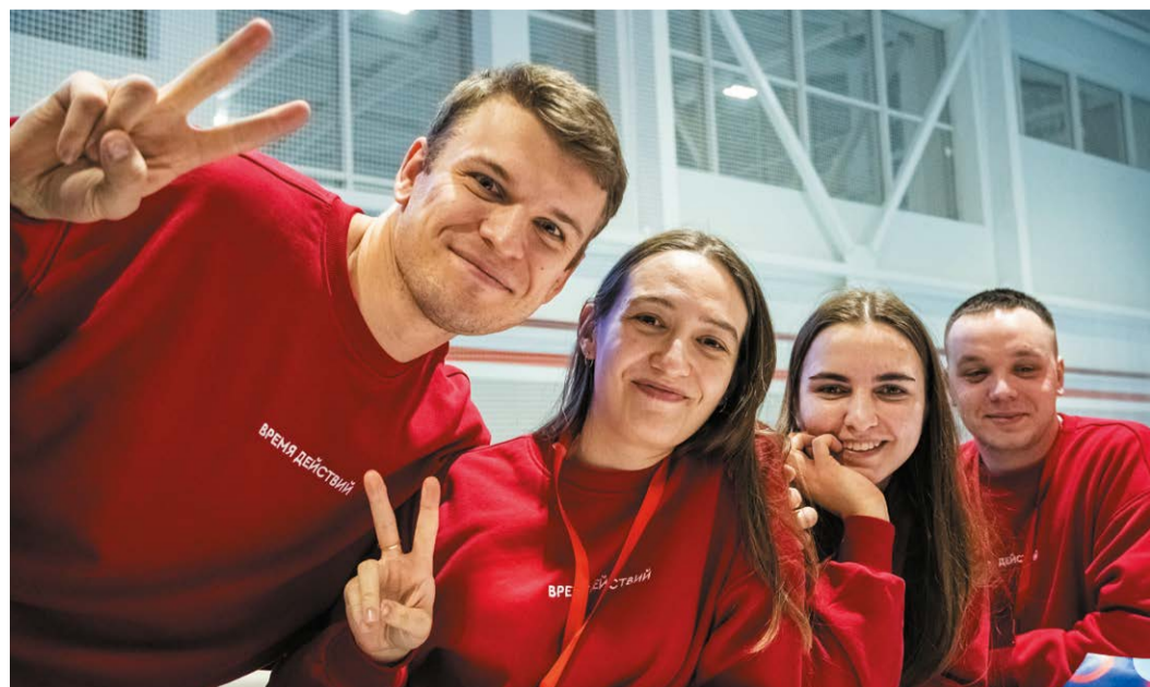
Атмосфера молодежного форума – как на встрече старых друзей