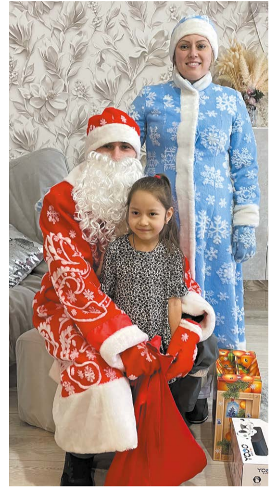
Нерюнгринские газовики участвовали в новогодней акции «Елка добра»

На Камчатке акция «Письмо Деду Морозу» проводится второй год подряд и многим понравилась. Дети, находящиеся под опекой подшефного центра социальной помощи «Семья», в начале декабря пишут о своих желаниях, изображают их на бумаге и высылают сотрудникам центра и Камчатского филиала. Далее полученные мечты «сортируют» и направляют в Великий Устюг. Чтобы главный герой русских сказок вовремя успел поздравить ребят, к акции подключаются все работники филиала и вручают подарки от Деда Мороза.