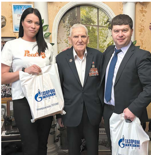
Накануне праздников внимание приятно не только детям

Молодые сотрудники Инженерно-технического центра приехали с презентами к детям подшефного учреждения «Басандайская жем-