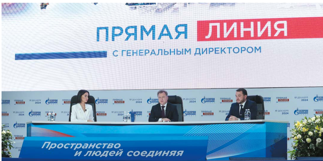
Впервые «Прямая линия» прошла в «Гармонии»

Руководитель предприятия отвечал на вопросы почти три часа. Он не оставил без внимания темы перспектив предприятия, заработной платы, социального пакета, обучения персонала, повышения цифровых компетенций, условий для молодых специалистов.