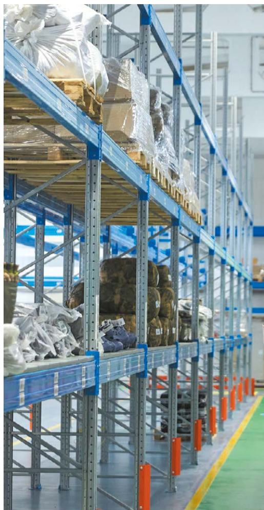
«Цифровой склад» запущен в опытную эксплуатацию на базе УМТС и К

лярных осмотров производственных объектов. Он оснащен лазерным газоанализатором и способен самостоятельно выполнять сканирование мест возможных утечек метана. Робот изготовлен в Томске и является совместным проектом компаний «Газпром трансгаз Томск» и «Когнитив Роботикс». Первые испытания робота под контролем оператора прошли в сентябре на компрессорной станции «Володино».