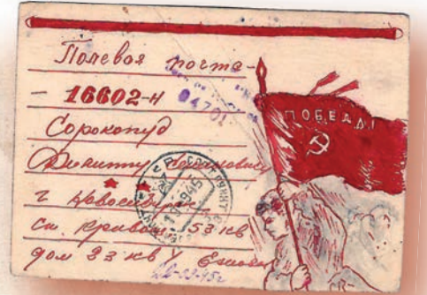
С 1941 года начался выпуск карточек-бланков без иллюстраций. Чуть позже их стали печатать с рисунками

В 2024 году пересылаемые без конвертов открытые письма, или открытки, отмечают 155-летие. Первые образцы были изданы в Австрии в 1869 году, а уже через три года они появились и в России.