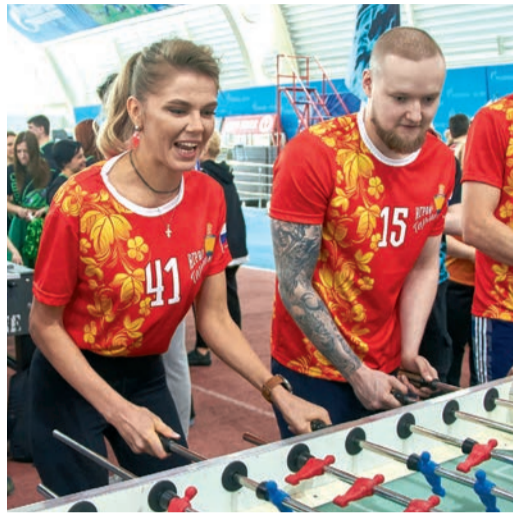
Как было написано на футболках арбитров, кикер – это тоже спорт