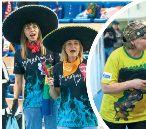
Состязания болельщиков в креативности и шумовой поддержке – девятнадцатая дисциплина Спартакиады