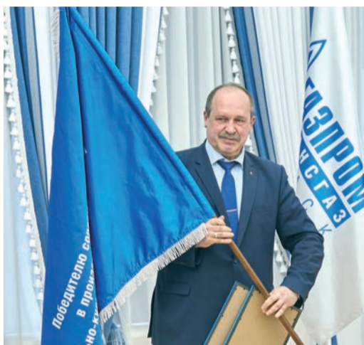
УТТиСТ становится лучшим среди филиалов вспомогательной деятельности третий год подряд