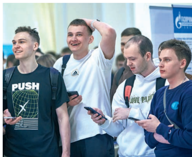
По итогам онлайн-квиза участники ярмарки вакансий могли выиграть призы от дочерних обществ ПАО «Газпром»

ния «Газпром» в течение многих лет реализует стратегические проекты взаимодействия с