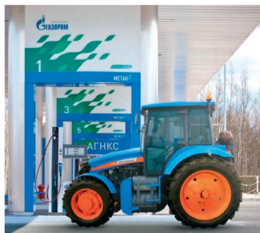
Выпущены первые образцы тракторов и комбайна на природном газе

Кроме того, в интересах отечественных автопроизводителей Газпром совместно с российскими промышленными предприятиями работает над выпуском комплектующих для сборки газомоторного транспорта. В 2023 году Газпром запустил в Московской области первое в стране серийное производство подкапотного газобаллонного оборудования для автомобилей на КПП. В Республике Татарстан АО «РариТЭК Холдинг» начало производство широкой линейки криогенных топливных баков для транспорта на СПГ.