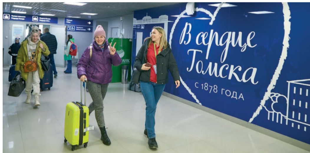
В Томск приехали участники из 14 регионов Сибири и Дальнего Востока

Корпоративный фестиваль самодеятельных творческих коллективов и исполнителей ООО «Газпром трансгаз Томск» «Новые имена» проводится с 2004 года. Лучшие коллективы «Новых имен» будут представлять предприятие на корпоративном фестивале ПАО «Газпром» «Факел».