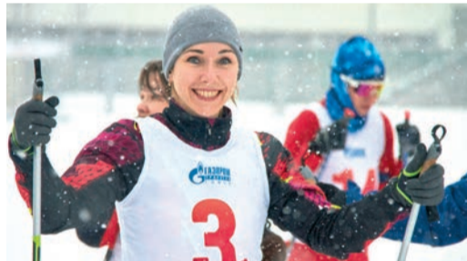
Лыжная эстафета прошла в один из последних прохладных дней марта