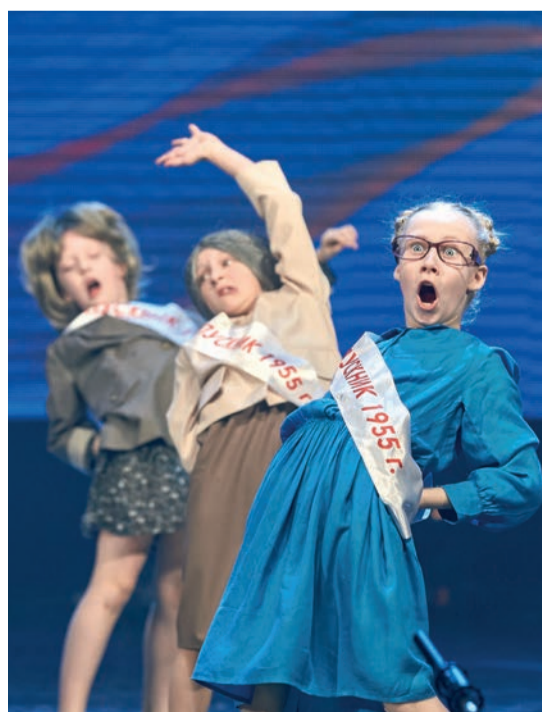
«Небесные ласточки» стали одними из главных звезд «Новых имен»