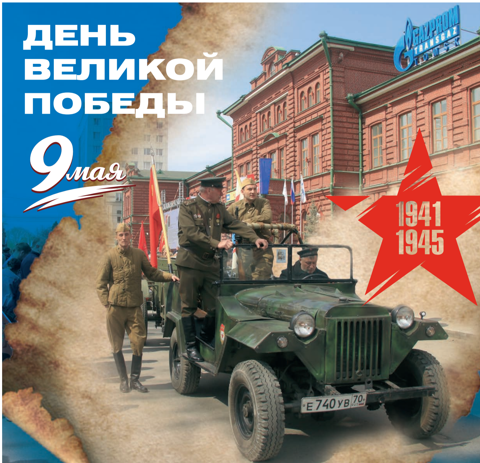
Как газовики встречают 9 Мая – стр. 12