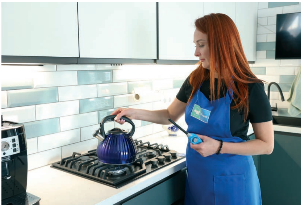
В рамках догазификации обеспечена техническая возможность подключения к газовым сетям более миллиона домовладений

В 2024 году Газпром наращивает темп работ по газификации и догазификации рос-