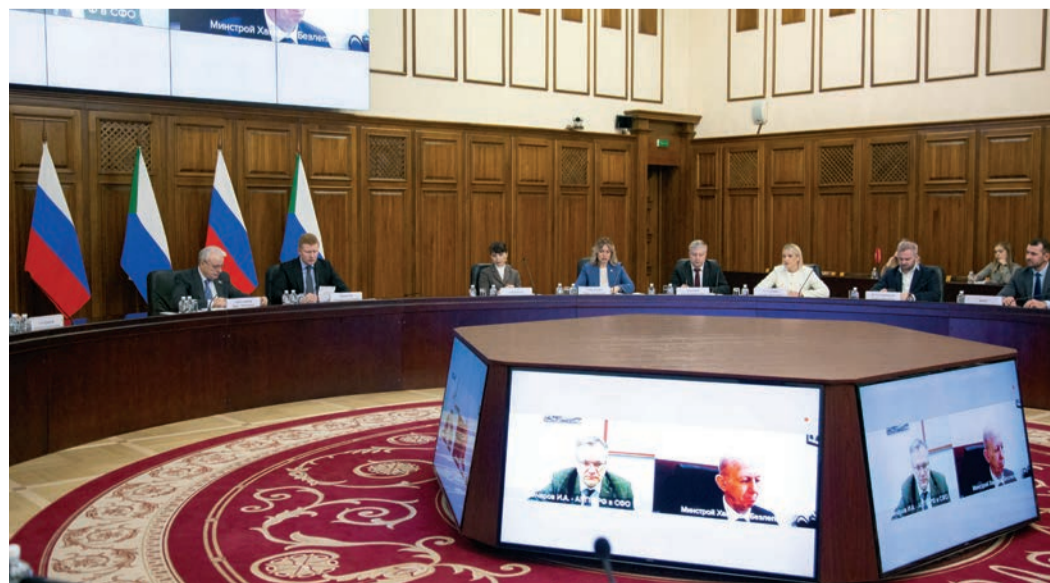
Заседание выездного круглого стола комитета по энергетике Государственной Думы РФ