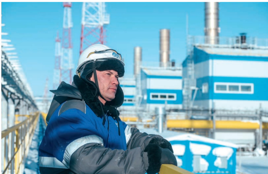
На Бованенковском месторождении

Особенно морозными были декабрь 2023 года и январь 2024 года, когда средняя температура наружного воздуха в зоне действия Единой системы газоснабжения (ЕСГ) была ниже климатической нормы. Пик аномальных холодов пришелся на первую половину января: 12 января средняя температура снизилась до минус 14,3 °С, а 13 января — до минус 19,8 °С. Поставки по газотранспортной системе Газпрома осуществлялись стабильно. Дважды был установлен абсолютный исторический максимум суточных поставок газа: 12 января — 1788,3 млн м 3 , 13 января — 1814,7 млн м 3 . До этого рекордный показатель