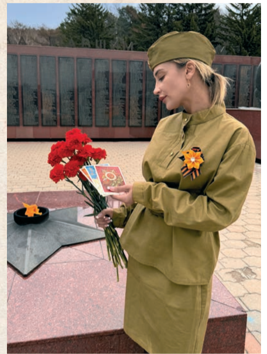
Работники Сахалинского филиала участвуют во всех патриотических инициативах «Газпром трансгаз Томск»