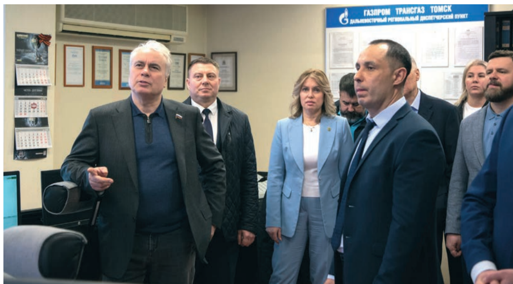
Участники совещания в Дальневосточном региональном диспетчерском пункте