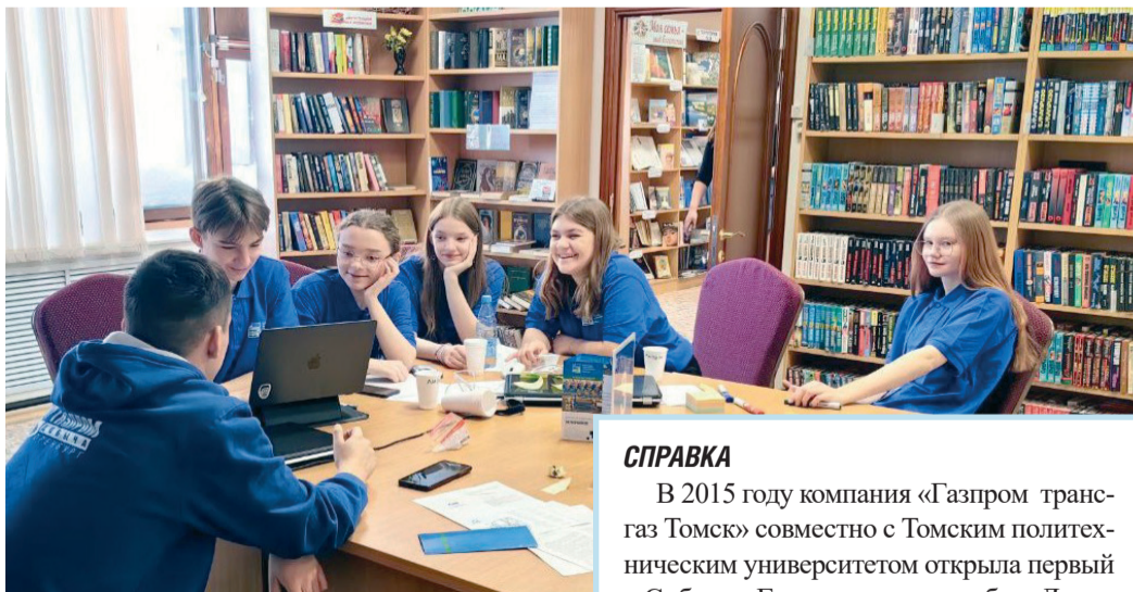
В составе команд – дети из разных регионов

– Отбор среди учеников был серьезный: мы знали, что задания на слете будут непростыми. Не каждый сможет без подготовки разработать кейс по укладке подводных коммуникаций или по упрощению процесса адаптации молодых работников при трудоустройстве. Наши ребята справились на отлично и приобрели бесценный опыт, – отметила на-