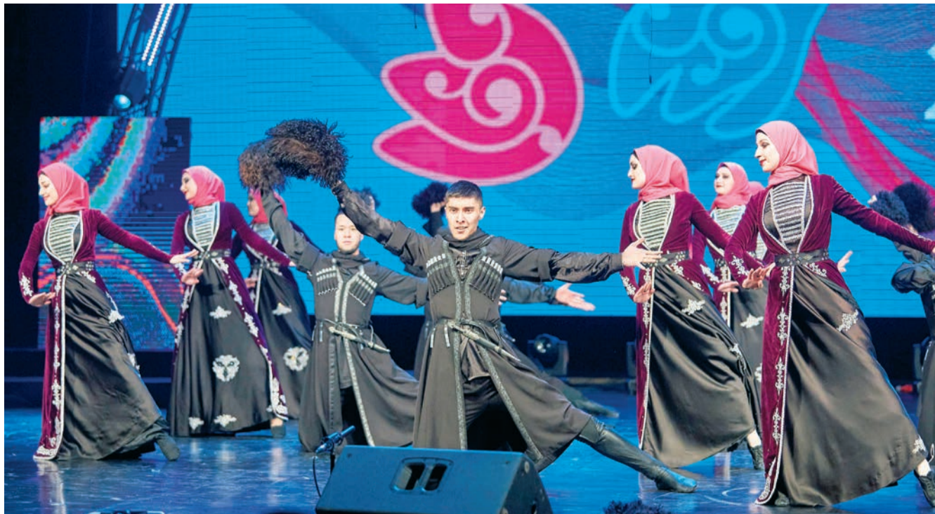
Конкурсные выступления участники представляли на сцене Томского областного театра драмы