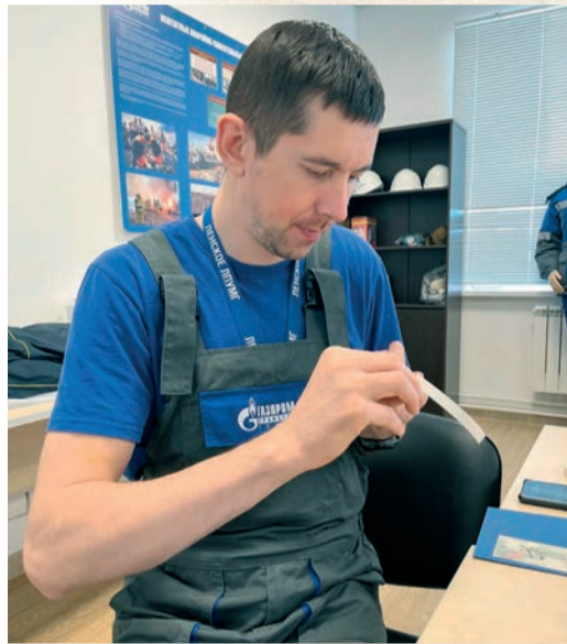
Газовики Ленского ЛПУМГ вкладывают в изготовление каждой открытки частичку себя

Накануне большой даты газовики из Ленского филиала провели акцию «Открытка ветерану» и сделали поздравительную карточку своими руками.