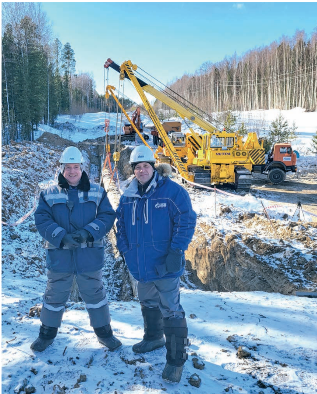
На севере Томской области в начале апреля еще лежал снег

С 16 по 22 апреля на участке МГ Парабель – Кузбасс специалисты линейно-эксплуатационной