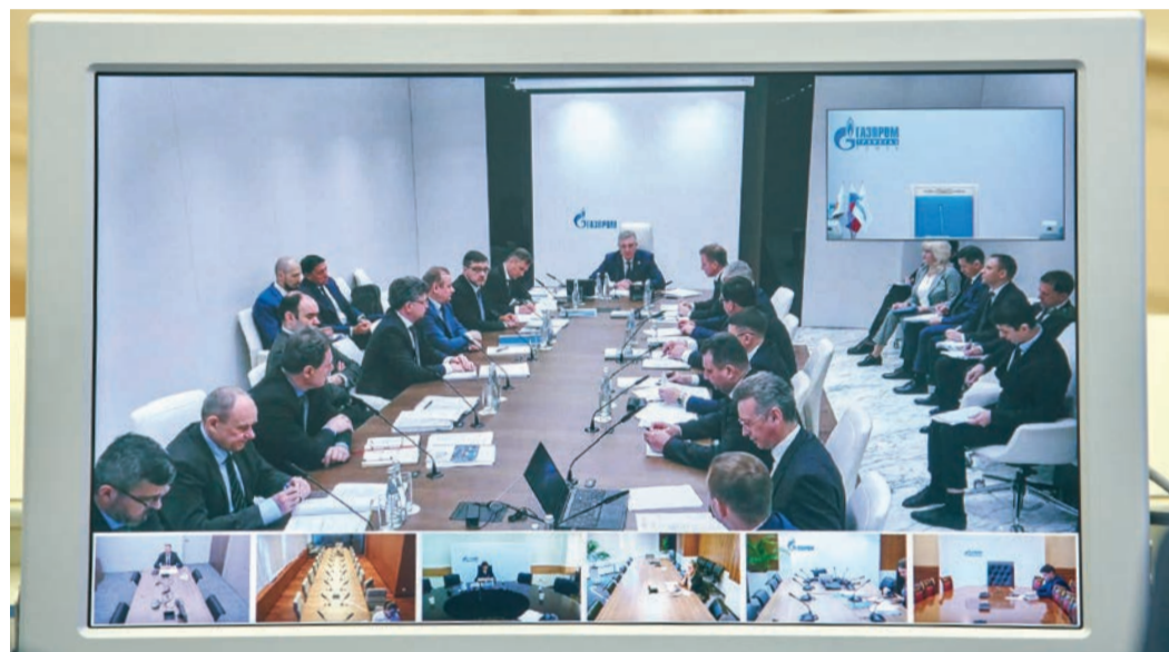
Рассмотрение итогов деятельности ООО «Газпром трансгаз Томск» проходило в очном формате