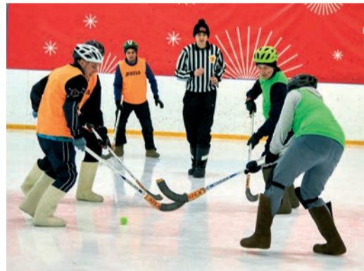
Хоккей в валенках: когда желание побеждает мастерство