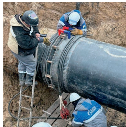
Устранение дефектов на МГ Омск – Новосибирск

службы Новокузнецкого ЛПУМГ провели работы по шурфовке и идентификации дефектов газопровода, выявленных при внутритрубной дефектоскопии.