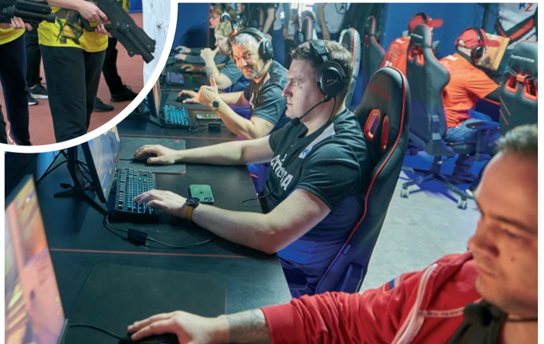
Газовики соревнуются не только на спортивных площадках, но и в онлайн-пространстве

▲ На один день спорткомплекс «Гармония» стал полем боевых действий