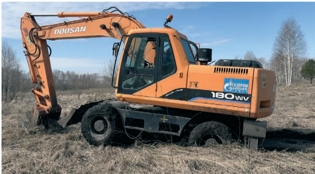
Подготовка к шурфовочным работам в зоне ответственности Новокузнецкого ЛПУМГ