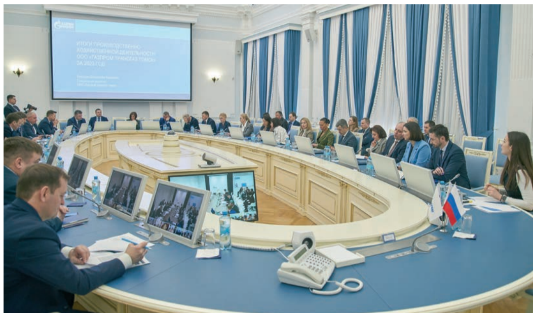
Трансляция совещания в Томске