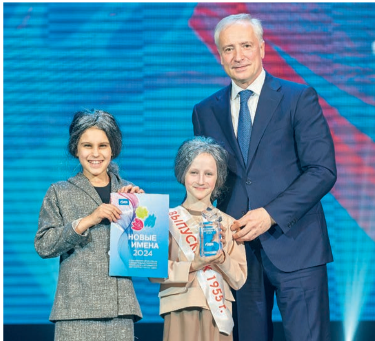
Губернатор Томской области Владимир Мазур награждает обладателей Гран-при фестиваля