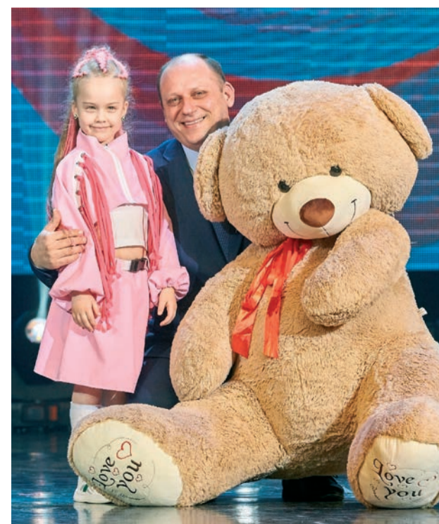
Приз для самой юной участницы