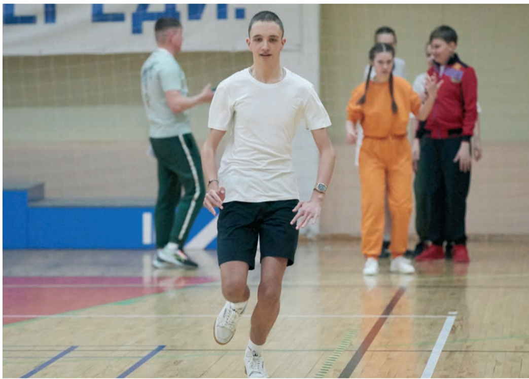
Томичи стали одними из лучших в спортивной эстафете, завоевав второе место