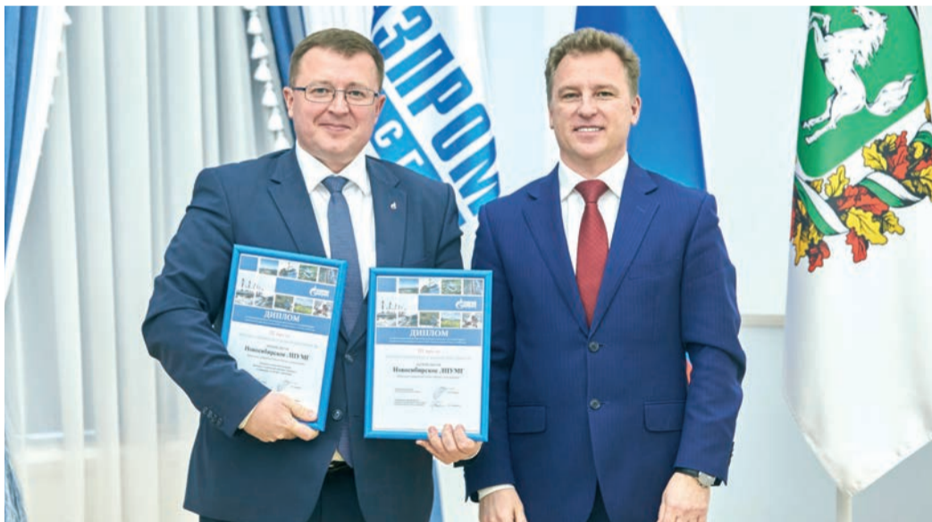
Новосибирское ЛПУМТ уже несколько лет находится на лидирующих позициях