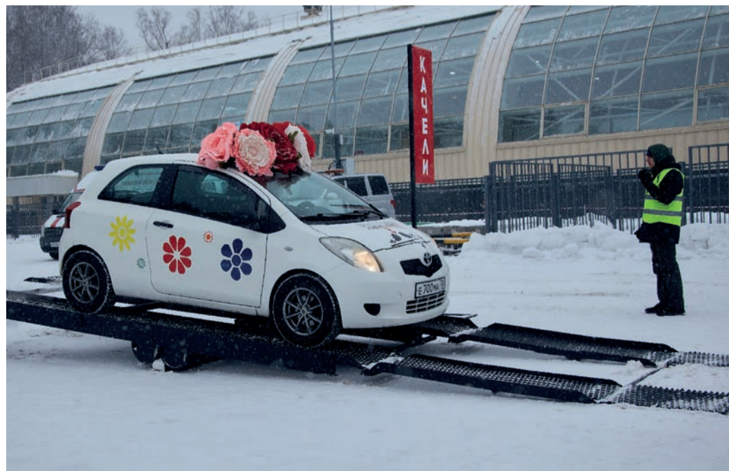
Упражнение «качели» традиционно стало одним из самых сложных