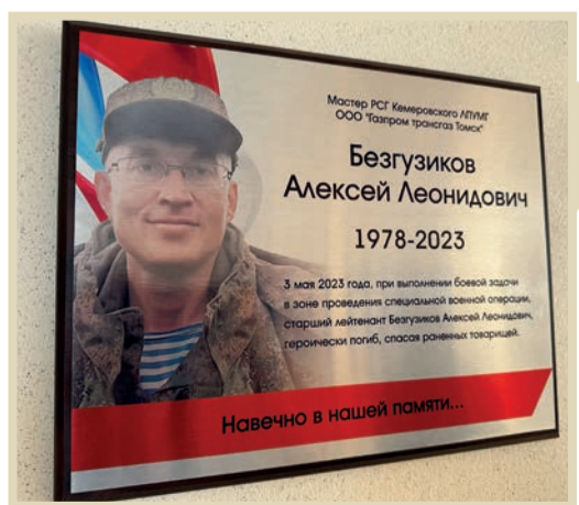
Памятная доска установлена в административном здании Кемеровского ЛПУМГ