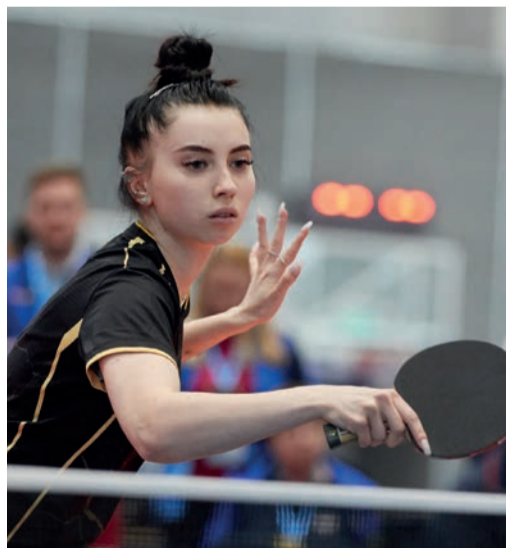
Теннисисты провели изнуряющий финал и, уступив в самой концовке матча, выиграли серебряные медали

— Эта Спартакиада была яркой и насыщенной. Наши спортсмены показали высокий уровень подготовки и отличные результаты. Поздравляю победителей с заслуженными наградами. Благодарю всех участников Спартакиады за проявленные упорство и волю к победе, а организаторов — за четкую и слаженную работу. Впереди — новые соревнования и новые рекорды. Дерзайте. Ставьте перед собой амбициозные цели и верьте в их достижение.