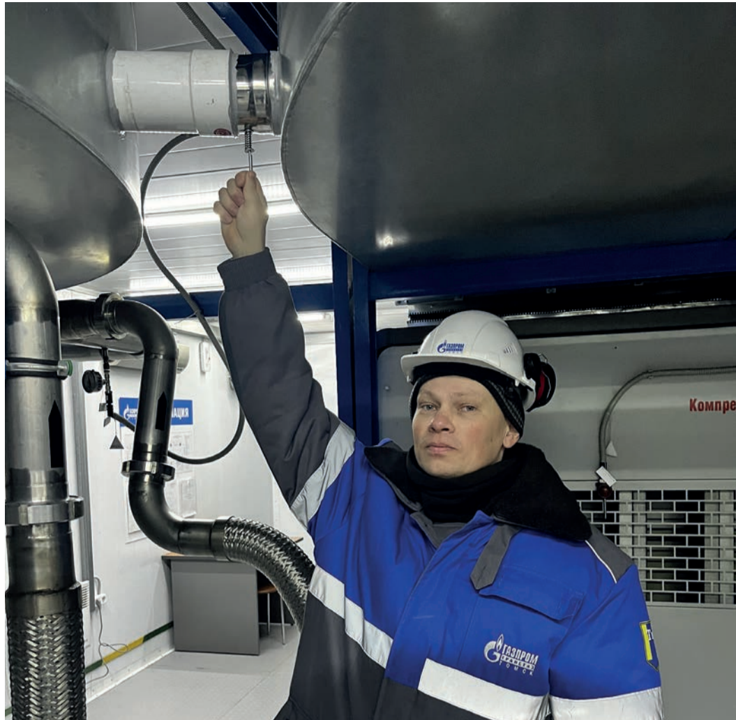
Техническое решение работников Александровского ЛПУМГ помогло продлить срок эксплуатации дорогостоящего оборудования

Заменили оборудование в октябре 2022 года во время капитального ремонта ЭГПА № 4 КС «ПарABELь». Испытания под нагрузкой проходили два дня. За 48 часов замечаний к