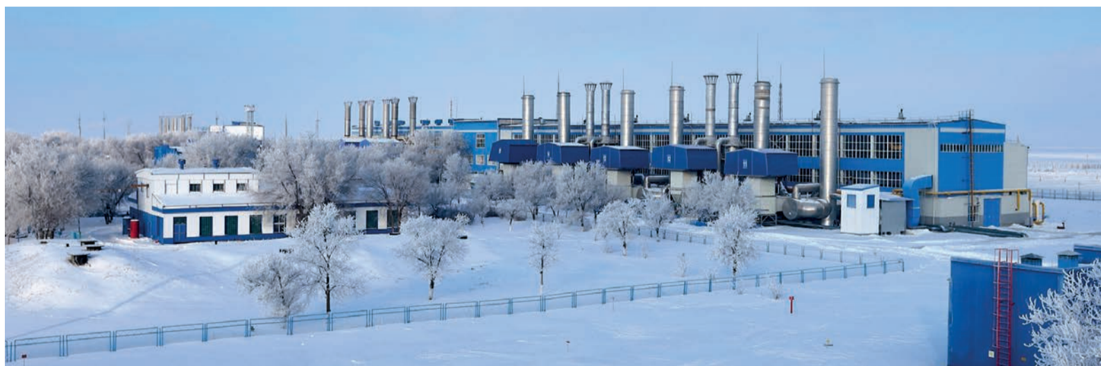
Компрессорная станция «Александров Гай»