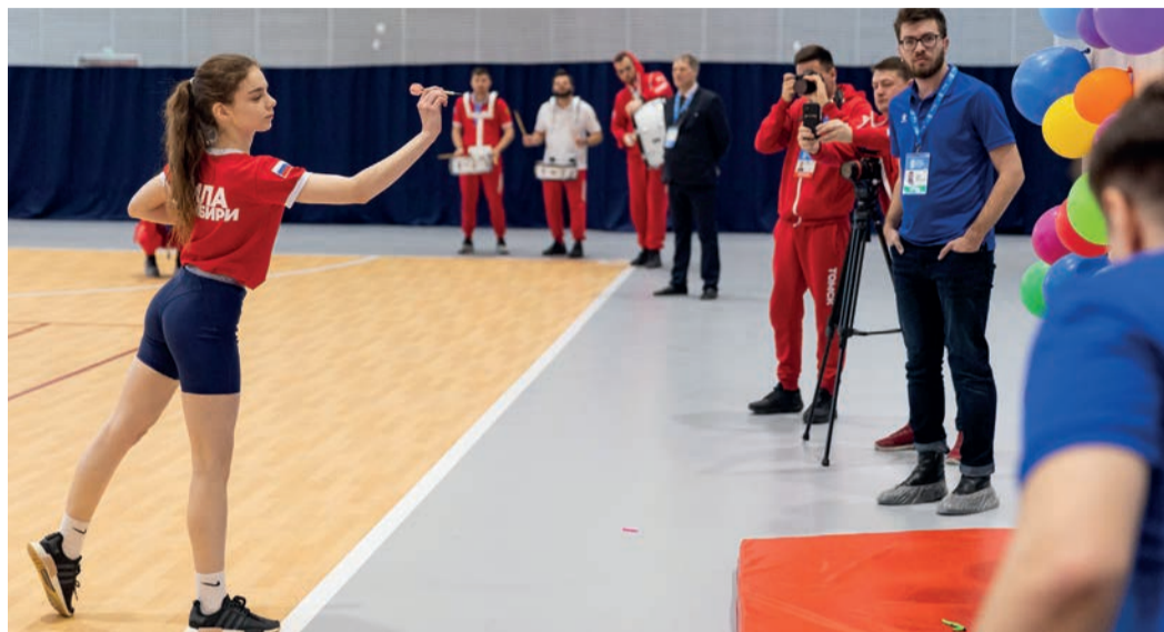
Команда целевых студентов ООО «Газпром трансгаз Томск» заняла первое место в одной из самых сложных и зрелищных дисциплин – спортивной эстафете