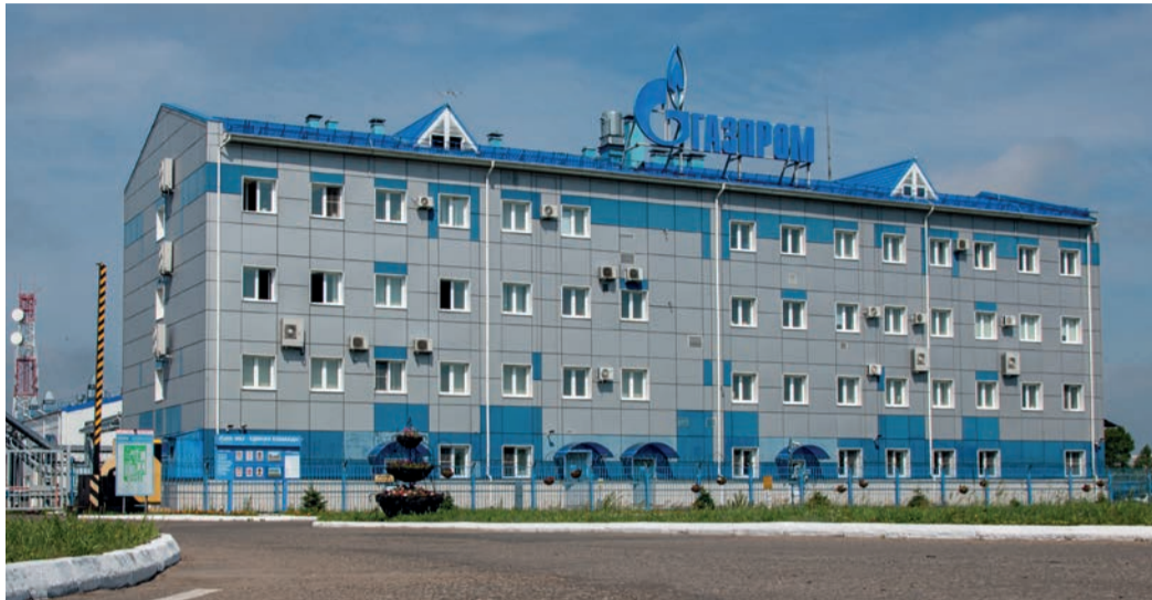
Производственная база управления расположена в Комсомольске-на-Амуре