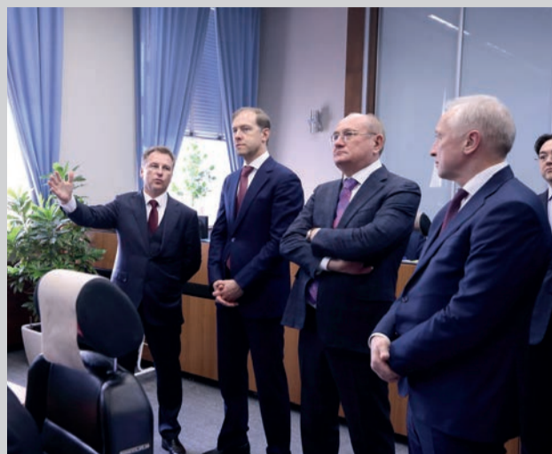
В диспетчерской ООО «Газпром трансгаз Томск»

МИНИСТР ПРОМЫШЛЕННОСТИ И ТОРГОВЛИ РФ ДЕНИС МАНТУРОВ И ЗАМЕСТИТЕЛЬ ПРЕДСЕДАТЕЛЯ ПРАВЛЕНИЯ ПАО «ГАЗПРОМ» ВИТАЛИЙ МАРКЕЛОВ ПОСЕТИЛИ ООО «ГАЗПРОМ ТРАНСГАЗ ТОМСК»