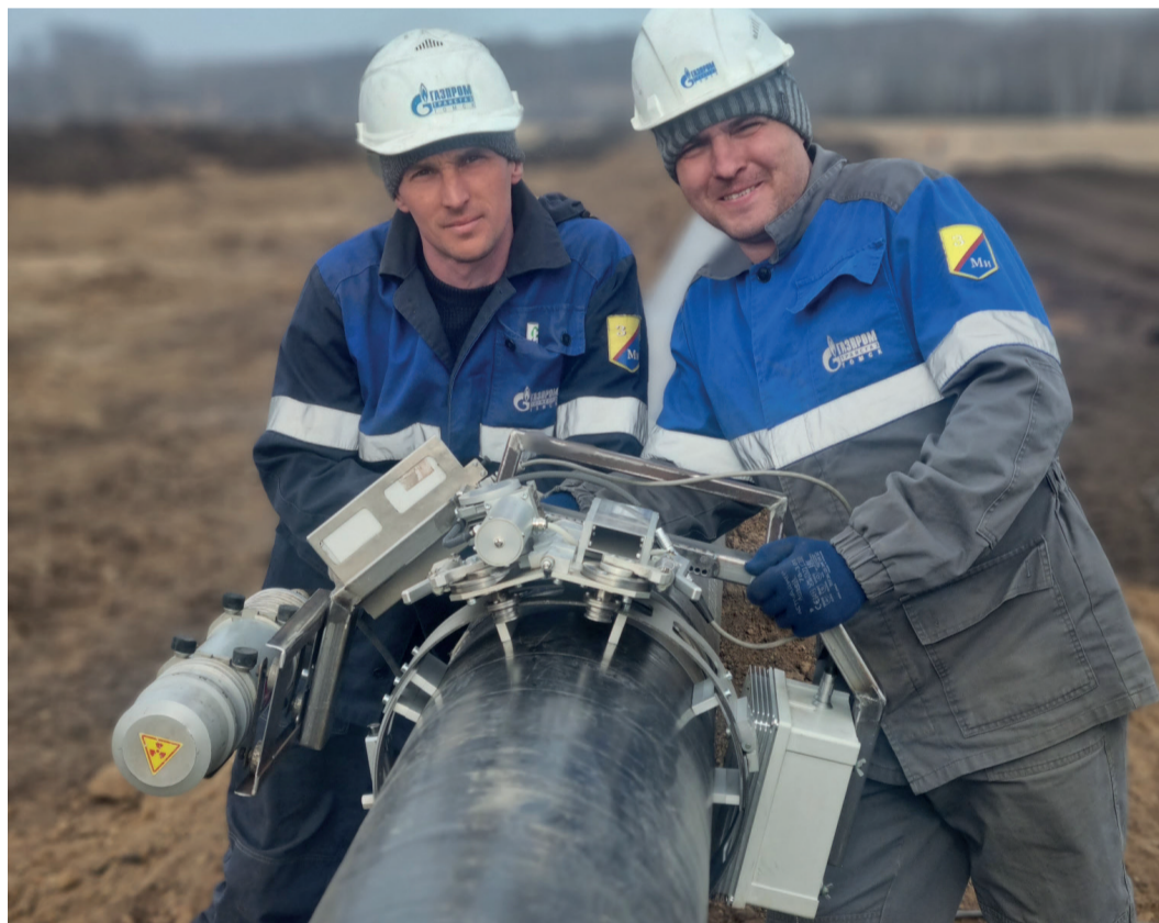
«Транскан» называют лучшим другом сварщиков