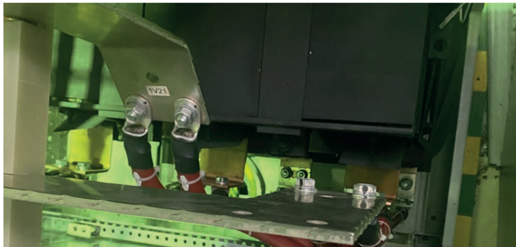
Отечественный реактор наработал уже более 5000 часов и зарекомендовал себя с лучшей стороны

работе реактора у специалистов не возникло. После этого он заработал в режимах «холодной прокрутки», «кольцо» и «магистраль».