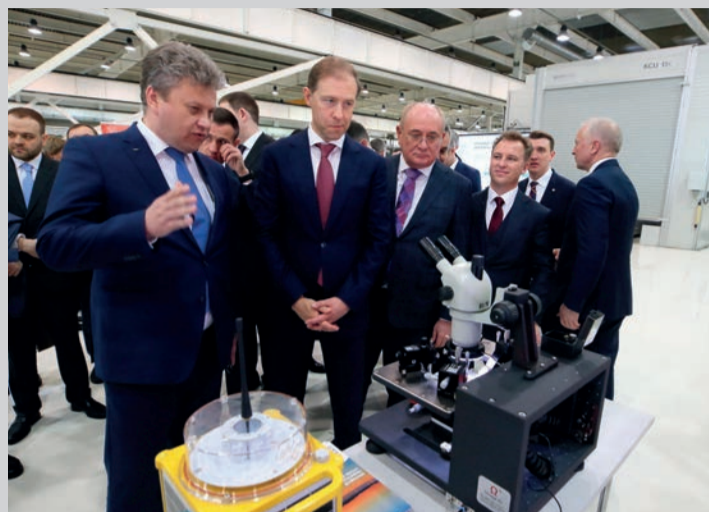
Осмотр выставки продукции промышленных предприятий