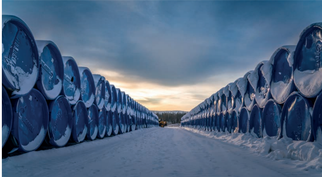
Проект предусматривает комплексное развитие газотранспортных мощностей на востоке России

В настоящее время Газпром реализует первоочередной этап проекта. Он предусматривает соединение действующих магистральных газопроводов «Сила Сибири» и Сахалин – Хабаровск – Владивосток. Для этого в 2024 году начато строительство