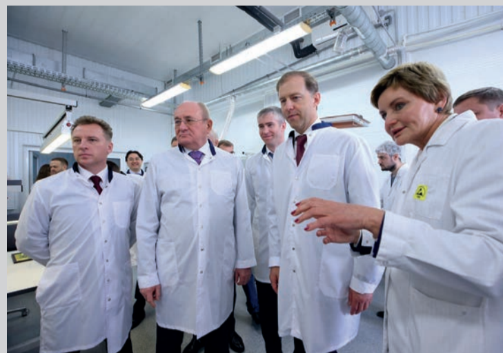
Посещение АО «НПФ «Микран»