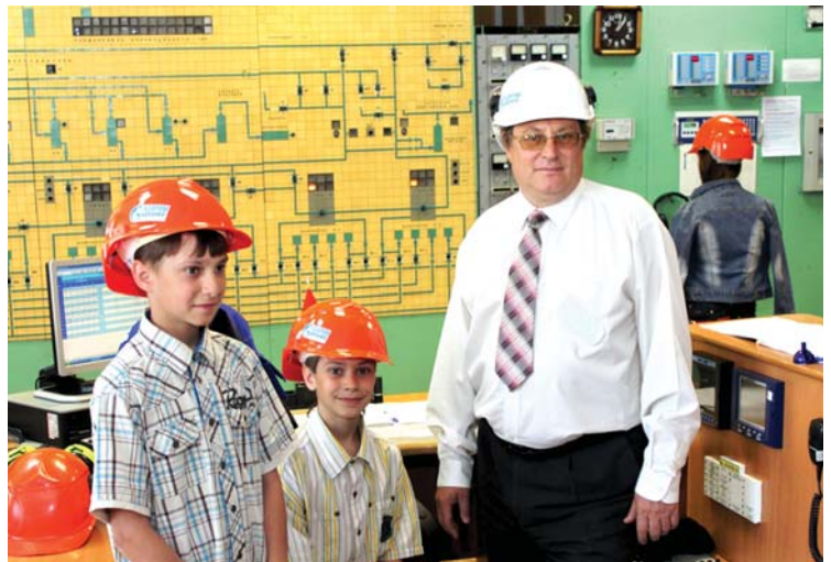
Ребята примерили на себя каску газовика