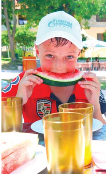
Лето-2012 – сочные и яркие впечатления