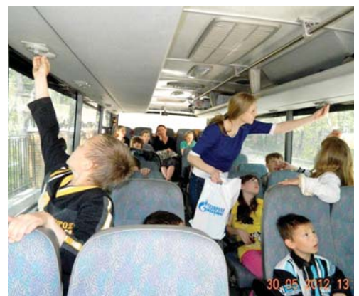
А лето выдалось жарким...