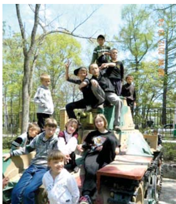
«Экстаз машины боевой»