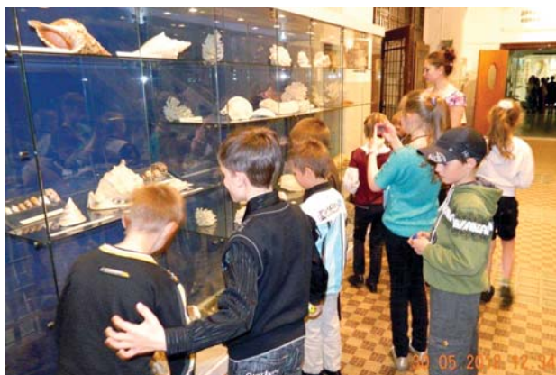
Музейная экспозиция поражает воображение