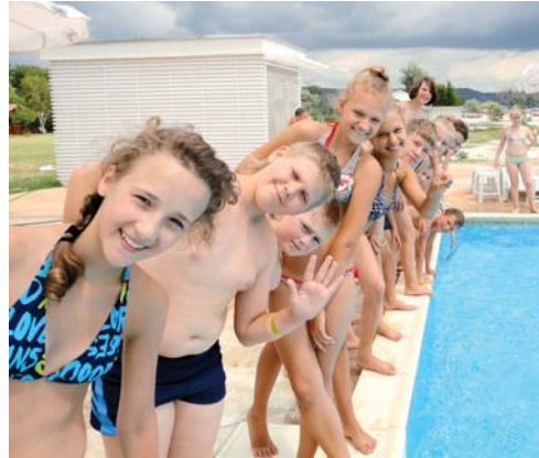
Встаньте, дети, встаньте в круг!