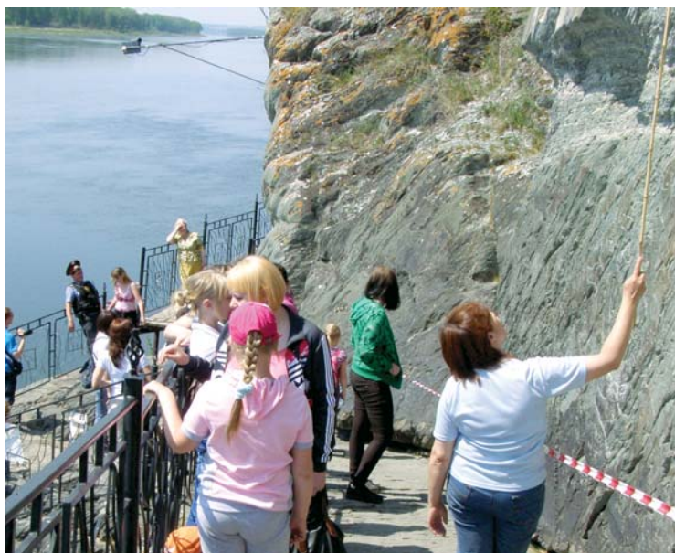
Юные газовики живут в гармонии с природой

Газпром прославить хочется, он много сделал дел: И людям помогает, и в спорте подсобляет, И даже для машины бензин изобретает. Хоть функций очень много возложено на вас, Но это не мешает вам добывать и газ!