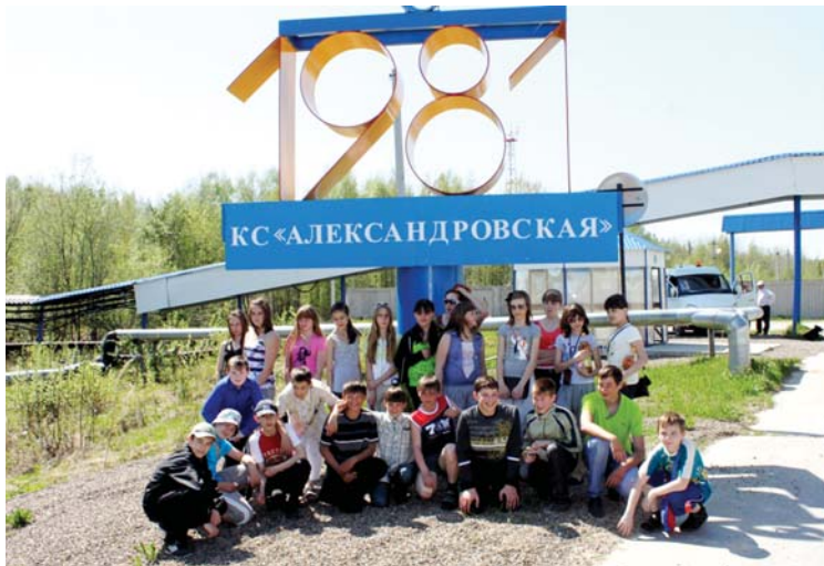
Место встречи изменить нельзя: на работе родителей